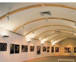
Arch. : Netanel Ben-Izchak