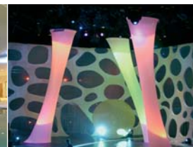
Arch. : Micro de la TSR