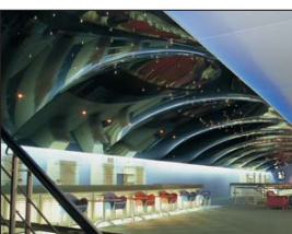
Arch. : Hakan Kiran

* I riferimenti P30, P40, P90 sono fabbricati esclusivamente in 36/100.