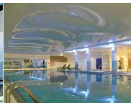
Arch. : Firoka