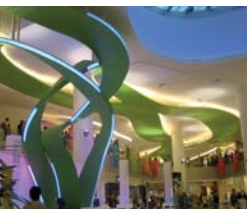
Arch. : ECO® ID