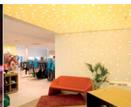
Arch. : Zebra