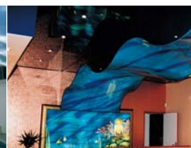
Création : Angel Moretta