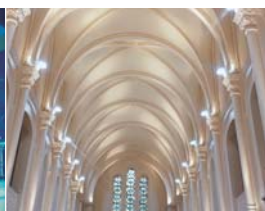
Yves Durand, S.T.D.E 2A