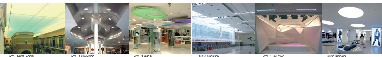
Arch. : Murat Denizati