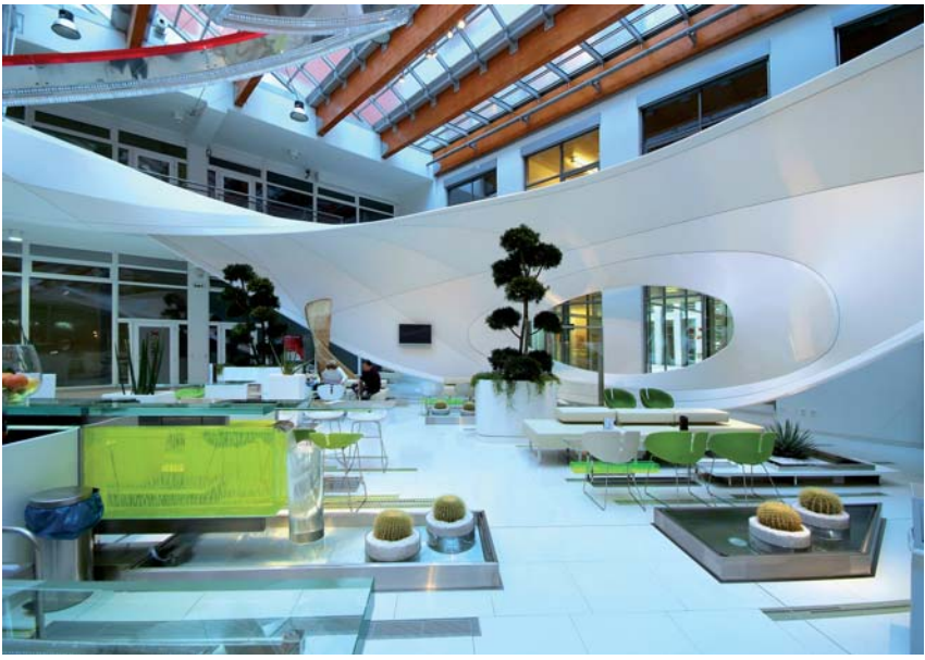
ARCHITECTE : FEDERICO DIAZ