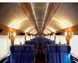
Arch. : David Betts & Paolo Dario

Visto que as cores foram imprimidas pode haver diferenças com a realidade, por isso a nossa carta de cores com amostras de tela está ao seu dispor. Os reflexos das telas lacadas podem variar em função das formas, separações e outros. A largura de telas sem soldadura pode variar entre 1m50 até 2m56 segundo a acado de tela escolhido. É favor consultar a tabela das larguras de tela para conhecer as medidas exactas. Segundo a intensidade de exposição ao brilho solar, da composição da atmosfera (fumo...) da peça, a côr pode variar com o passar do tempo.