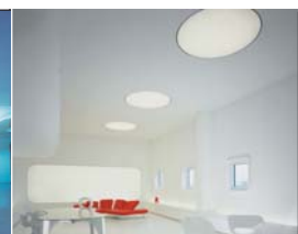
Design : Stephen Price - Bates