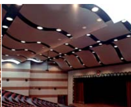
Arch. : Aydin Sesigur