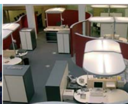
Arch. : Bredt & Partner