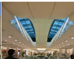
Arch. : H. Penaranda & Y. Valesco