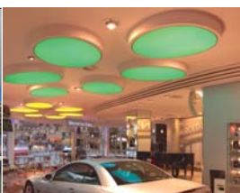
Arch. : Bärbel Thorner