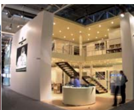
Arch. : Pilot Design