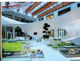
Arch. : Federico Diaz