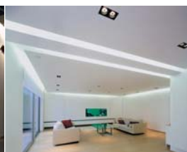
Arch. : Vanhaerents