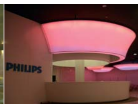
Arch. : Kingsmen Projects Pte LTD