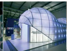
Arch. : Karim Azzabi