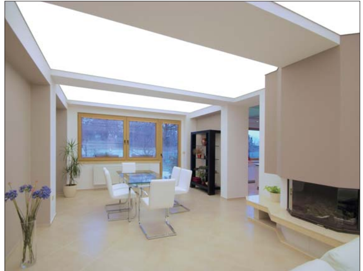
DESIGN : C.S. LYON PRAHA DESIGN

Die gedruckten Farben können in der Realität von der Darstellung abweichen; eine Broschüre mit Muster ist für genauere Abgleiche erhältlich. Der Spiegeleffekt der Lackfolien kann je nach Form, Aufteilung und weiteren Faktoren variieren. Die Folienbreite ohne Schweißnaht variiert je nach Folientyp zwischen 150 cm und 256 cm. Bitte überprüfen Sie die genauen Abmessungen in der Tabelle mit den Breitenangaben. Abhängig von der Sonneneinstrahlung und der Luftzusammensetzung im Raum (Rauch ...) kann sich das Erscheinungsbild der Folien zeitlich ändern.