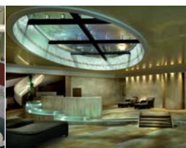
Arch. : The Syntax Group UK