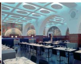
Arch. : Muma Company