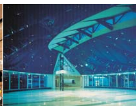
Arch. : Dalena Cermakova