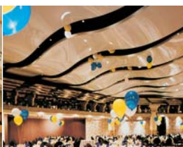
Arch. : Pietro Giordano