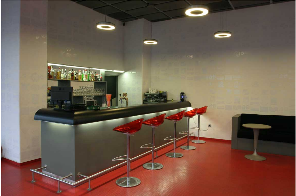
Büfé korabeli hangulatot árasztó belsőépítészettel