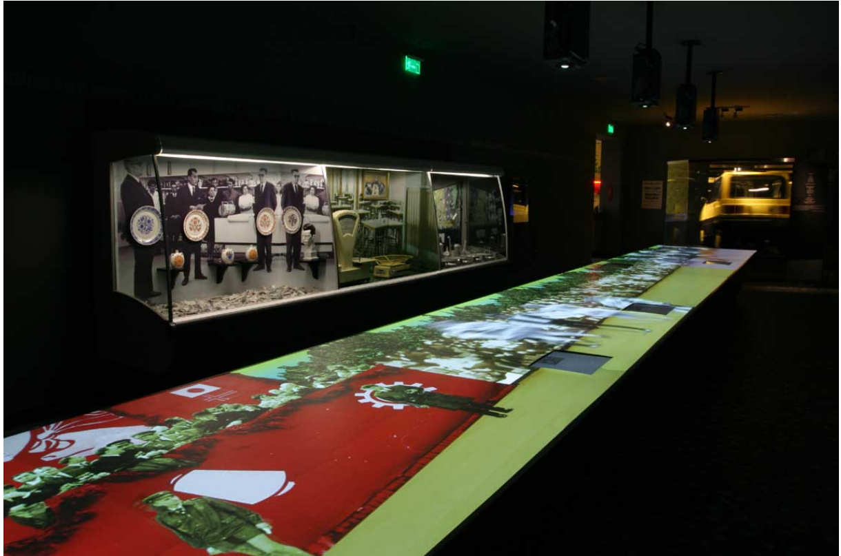
Interaktív vetített asztal