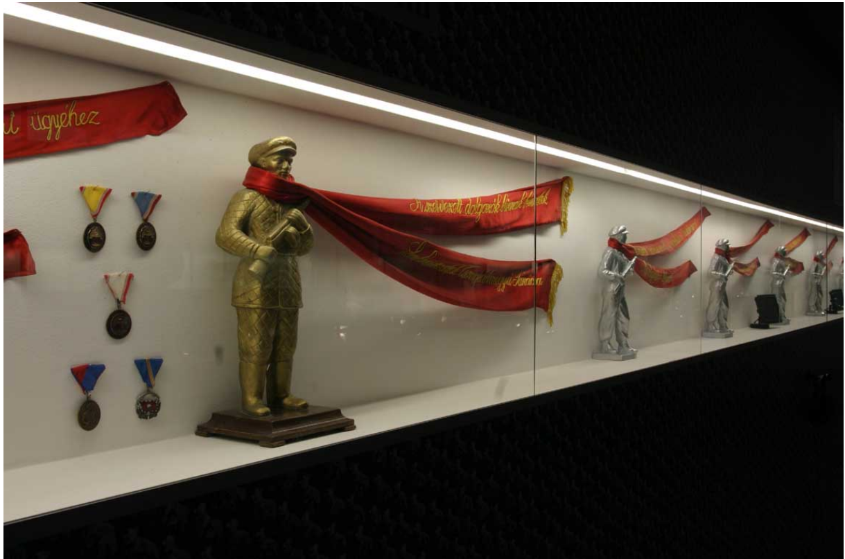
Rejtett fénycsöves vitrinvilágítás

A nagyvonalú terek a hagyományos világítási effektek számára is tág teret biztosítottak.