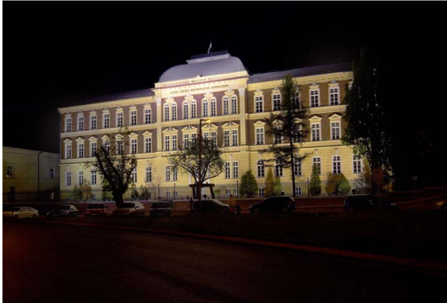
Lévay József gimnázium