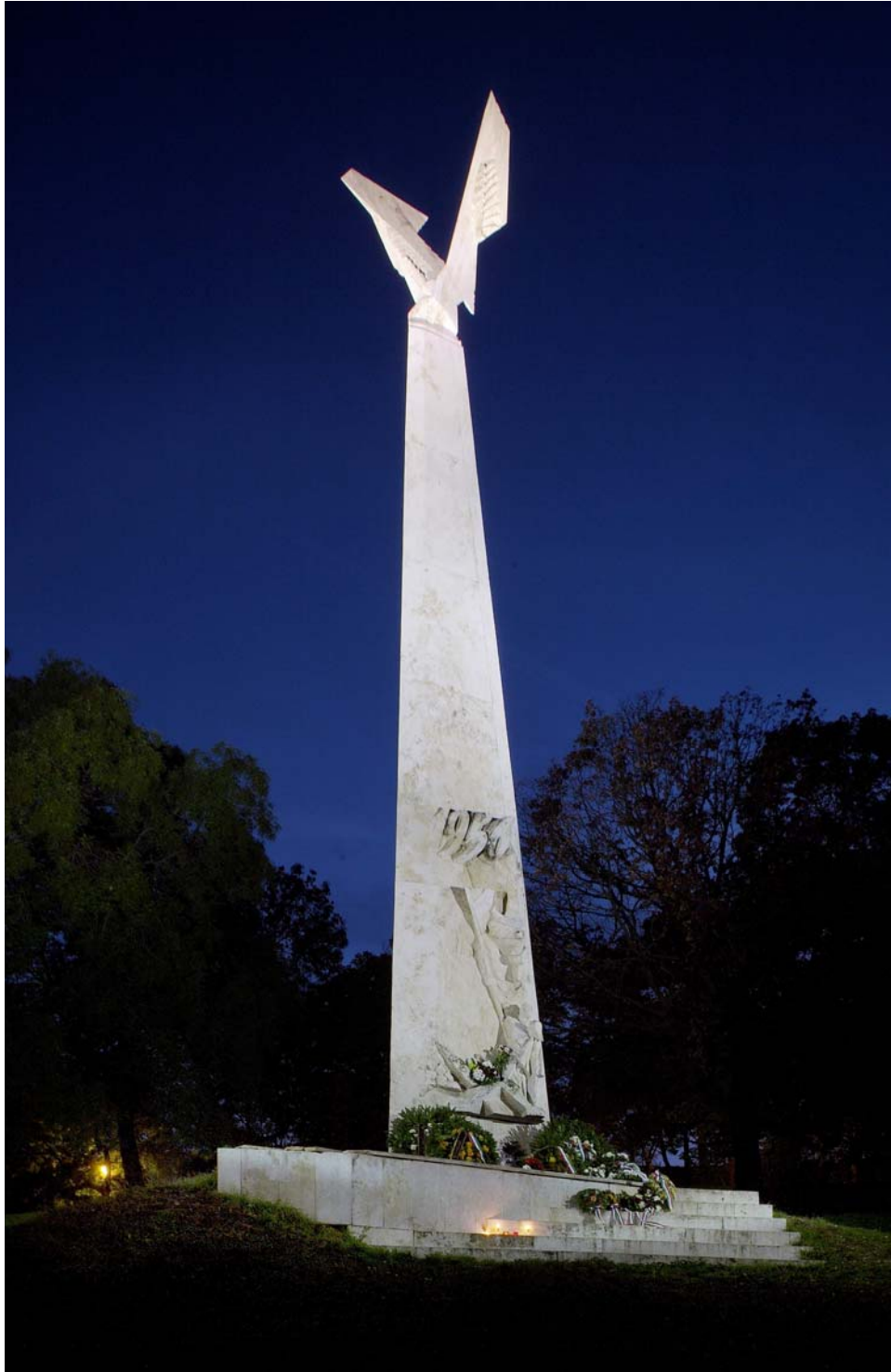
Tabán, 56-os emlékmű