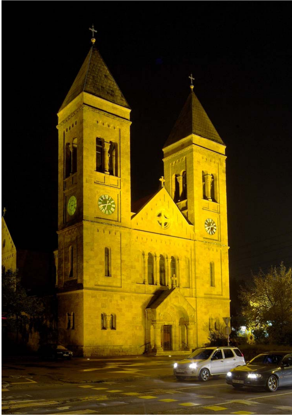
Szent Kereszt templom