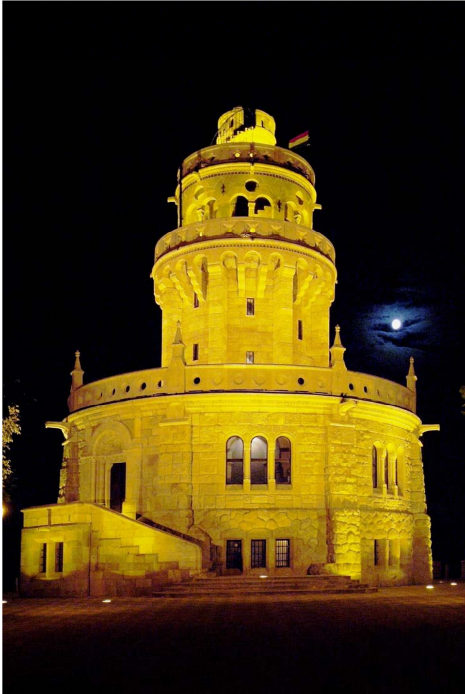
János-hegyi Erzsébet kilátó