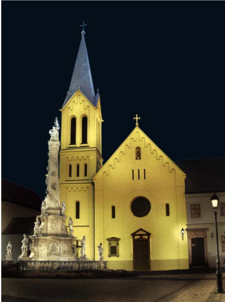
Veszprémi ferences templom és Szentháromság szobor