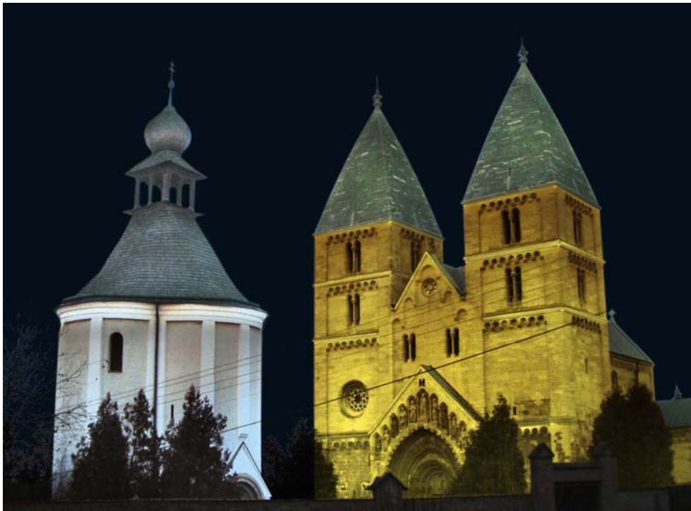
Jáki római katolikus templom