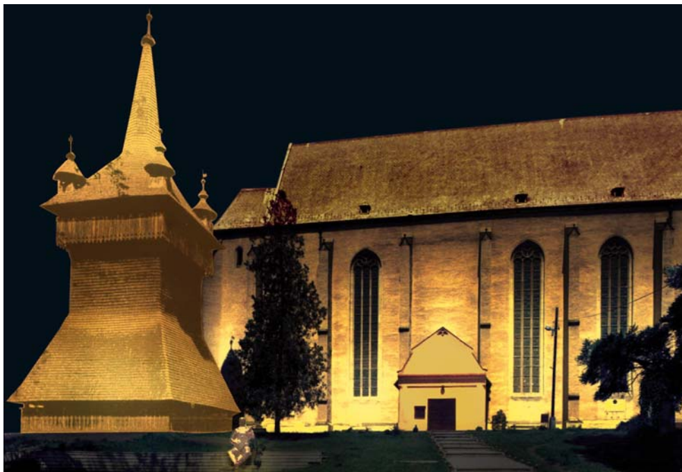
Nyírbátori református templom