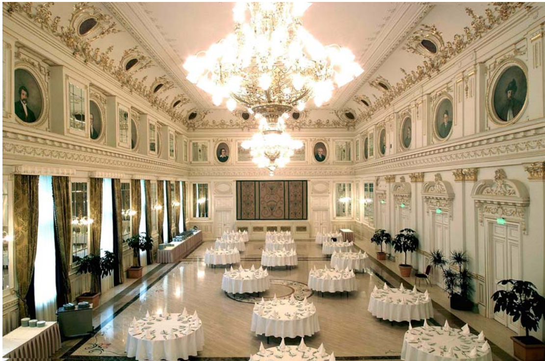
3 . ábra A bálterem ünnepi fényben