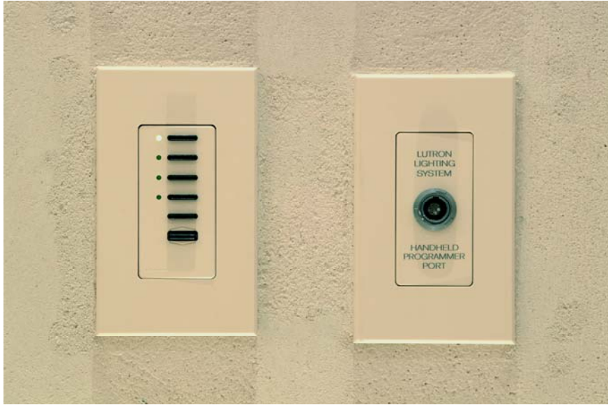
2 . ábra Fali kezelőpanel és programozó aljzat