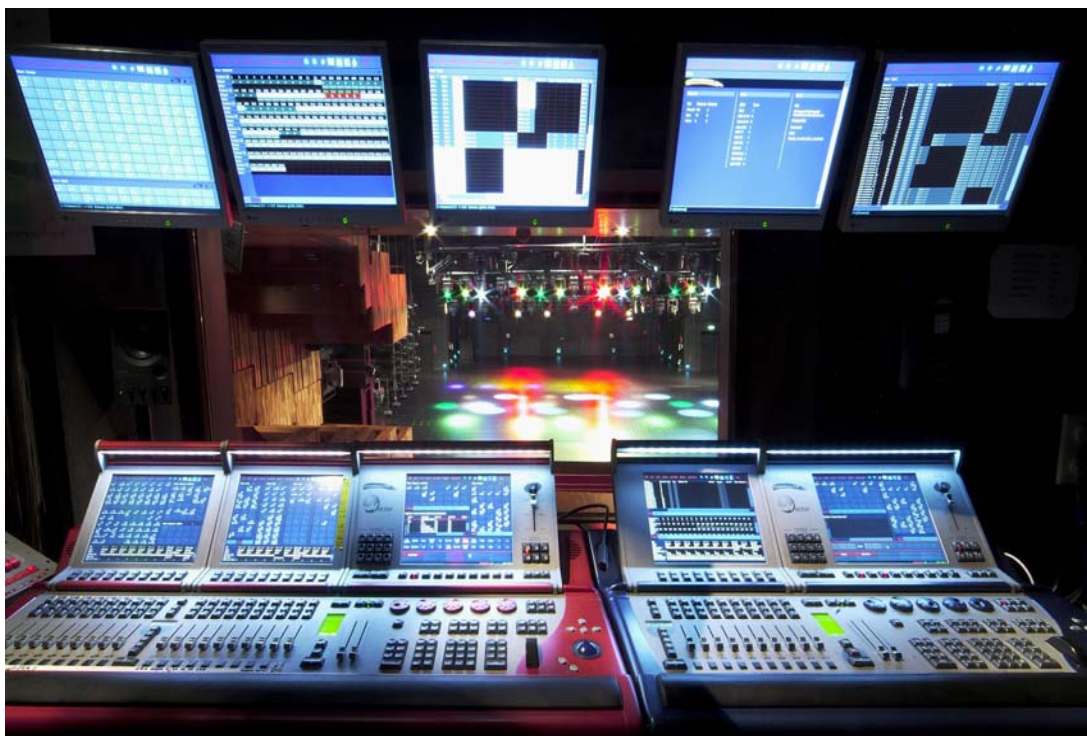
A Fesztivál Színház világitásvezérlő pultjai

Az előadások biztonsága érdekében mindkét játszóhelyen két-két világszínvonalú, egyenként több mint 4000 áramkört kezelni képes vezérlőpultot (Compulite VECTOR XL és VECTOR M) helyeztünk el, melyek a legbonyolultabb előadásokat is ki tudják szolgálni.