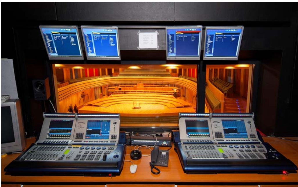
Kilátás a Nemzeti Filharmónia világításvezérlő helyiségéből

Rendkívül kiterjedt, a színpadokat és a nézőtereket is behálózó Ethernet, és DMX512 alapú vezérlési hálózat biztosítja a nagyszámú eszközpark biztonságos működtetését.