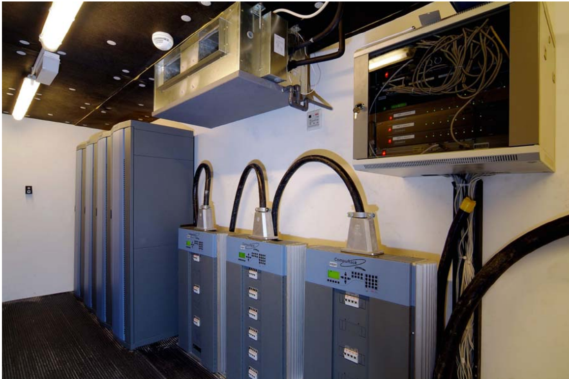
Nemzeti Filharmónia – Teljesítmény-szabályzó helyiség Compulite CompuDIM 2000 és CompuRack szekrényekkel

Az előadások biztonsága érdekében mindkét játszóhelyen két-két világszínvonalú, egyenként több mint 4000 áramkört kezelni képes vezérlőpultot (Compulite VECTOR XL és VECTOR M) helyeztünk el, melyek a legbonyolultabb előadásokat is ki tudják szolgálni.